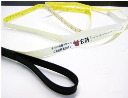
写真1 子牛の体重スケール（試作版）

今年の春に試作版を作成して、現在は、いくつかの農家や農協、普及センターの方々に実際に現地で使っていただいて、感想や意見を集約しているところです（「なかなか良さそうぞ」という意見が多いです）。寄せられた意見を参考にして、来年には完成版を作成したいと考えています。