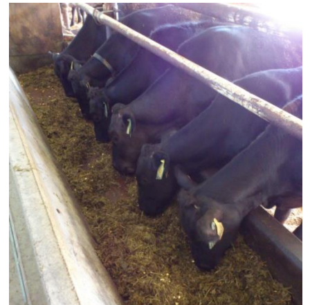
写真2 牧草サイレージをモリモリ食べる牛たち

試験を開始してから約 3 ヶ月が経ちますが、牧草サイレージの食い込みはよく、発育も順調です。育成試験は 11 月まで行い、その後、肥育して育成期の牧草サイレージ給与が枝肉成績へ及ぼす影響を検討します。